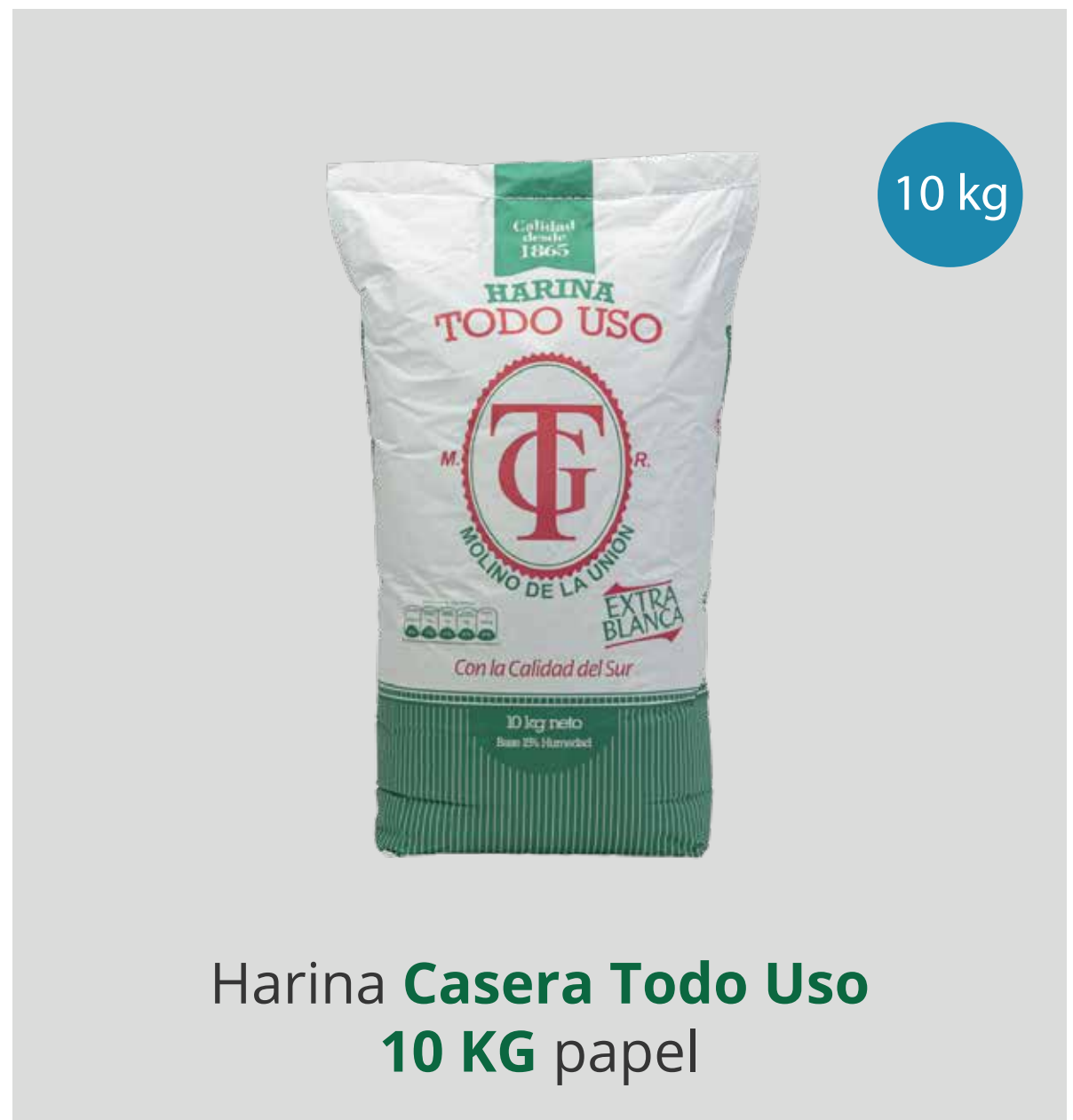
Harina Casera Todo Uso 10 KG papel