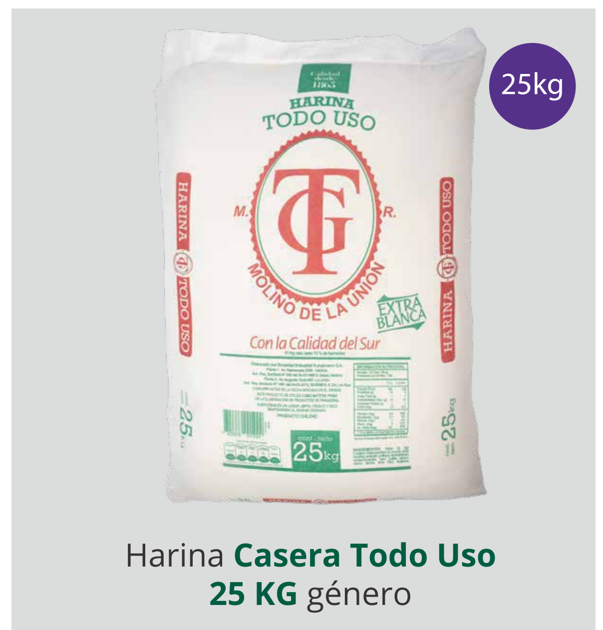
Harina Casera Todo Uso 25 KG género