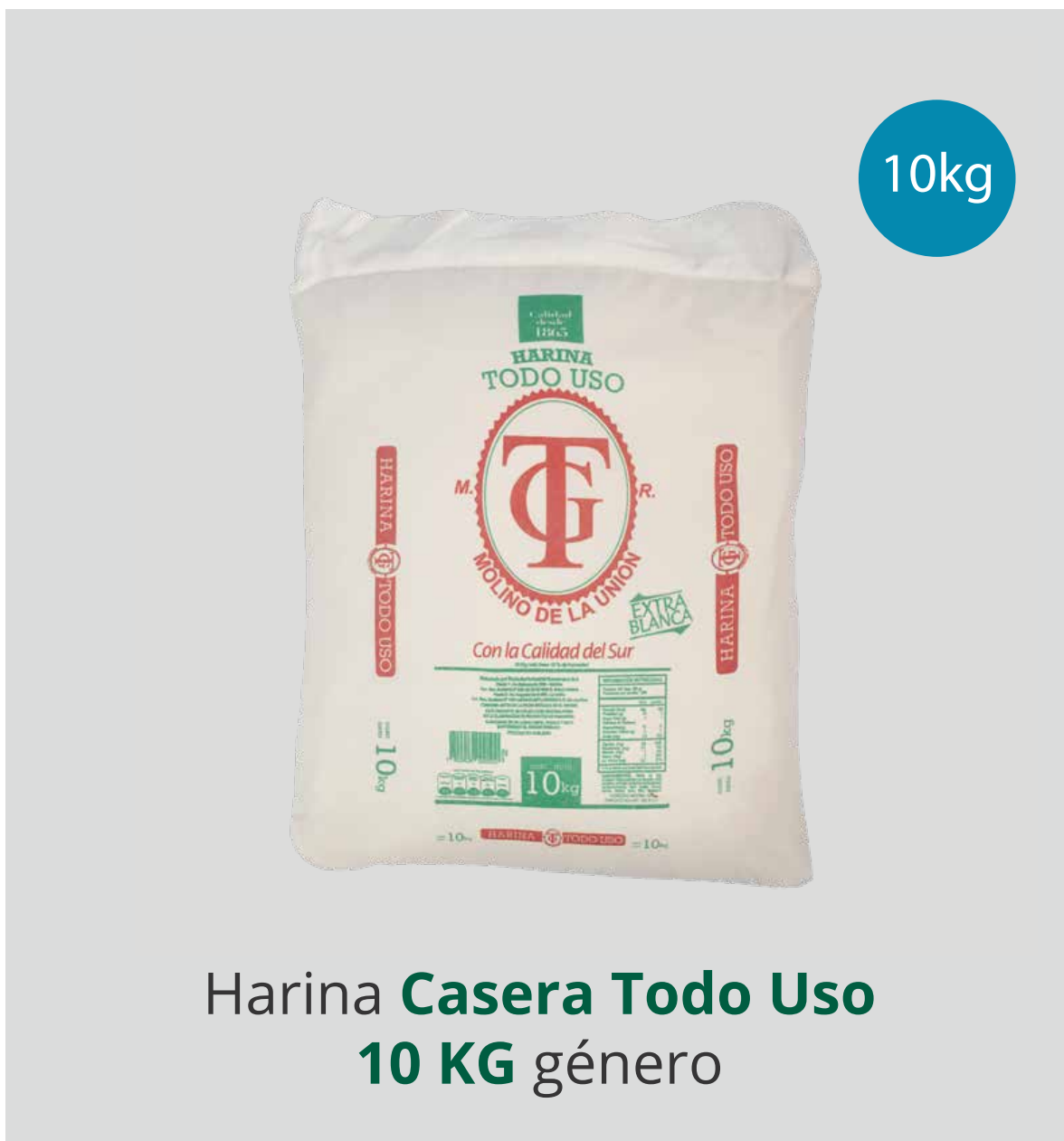
Harina Casera Todo Uso 10 KG género

Presentación: Papel 10 kg ; Género 10, 20, 25 kg