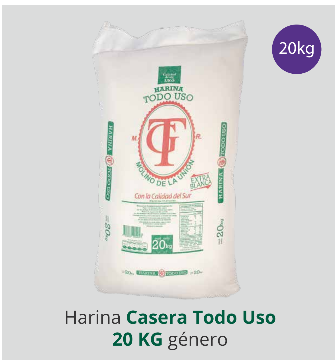
Harina Casera Todo Uso 20 KG género