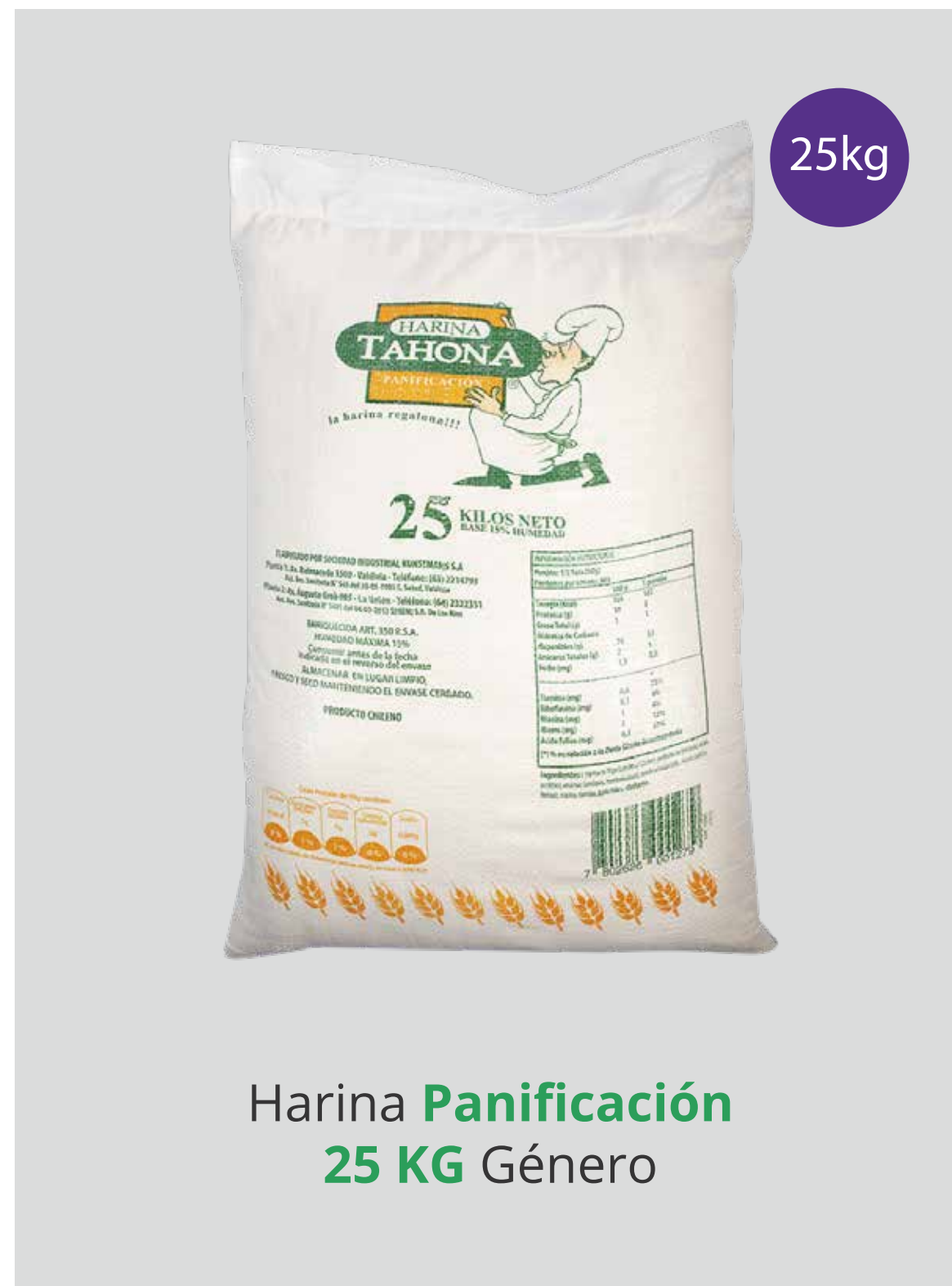
Harina Panificación 25 KG Género