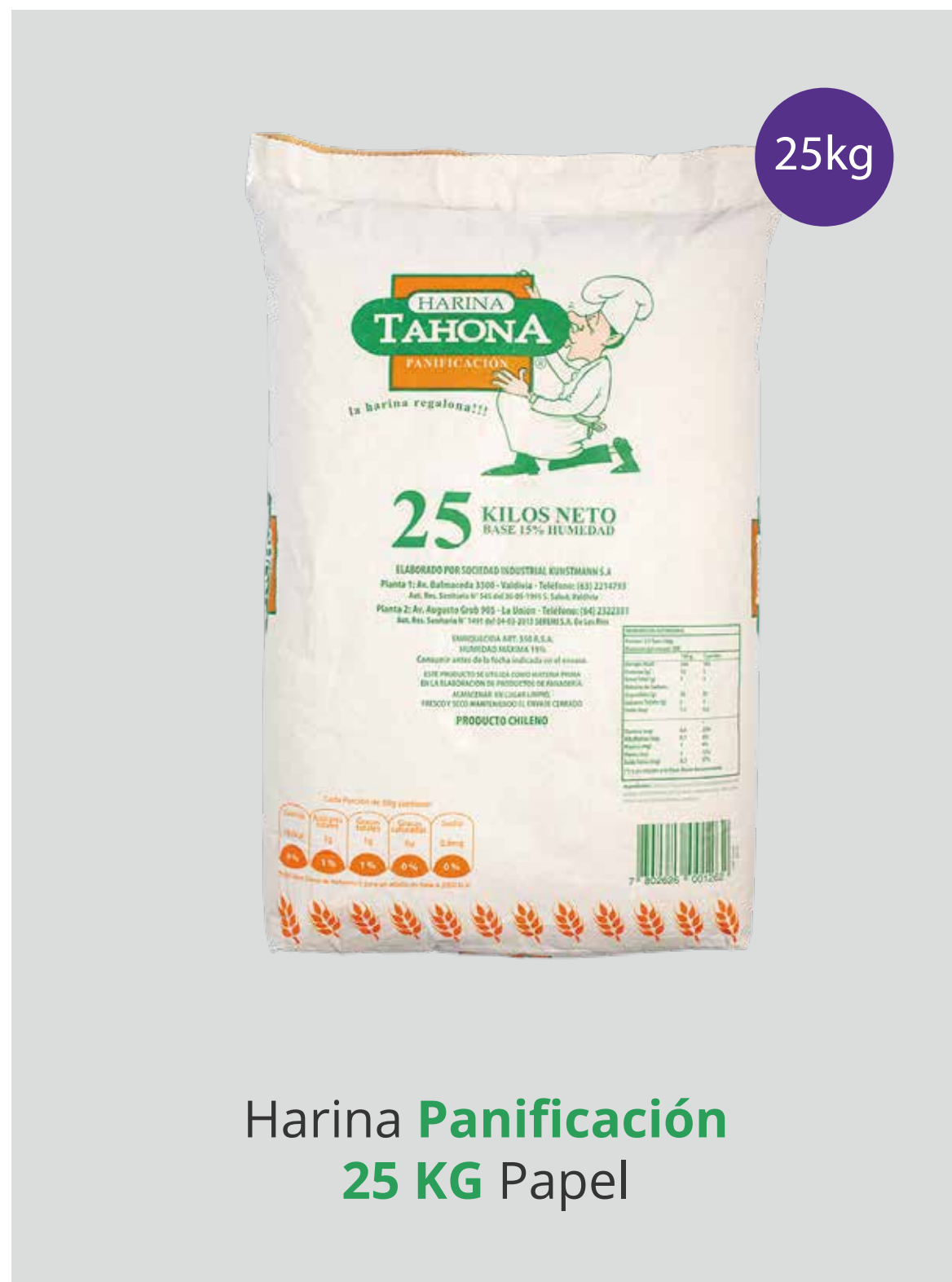
Harina Panificación 25 KG Papel

Presentación: Polipropileno y Papel 25 kg